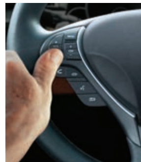
PIN-код вводится штатными кнопками. Это сохраняет стиль машины.

Гибкие настройки системы дают 3 варианта выбора: