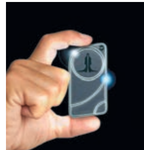
Метка «Призрак» - это удобно

PIN-код – Ваш секретный персональный код. Для его ввода используются штатные кнопки автомобиля. Например, стеклоподъемника или регулировки громкости магнитолы.